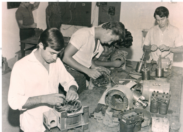
IF Sudeste de Minas Gerais, curso de Máquinas e Motores.

Década de 1960.