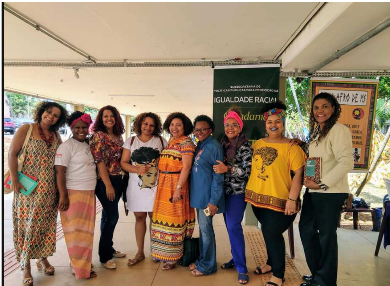
IV CONGRESSO DE PESQUIADORES/AS NEGROS/AS DA REGIÃO CENTRO-OESTE- 13/09/2019 – UFMS – CAMPO GRANDE –MS