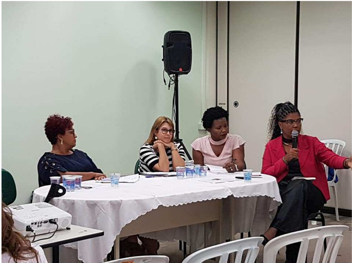
SBPC AFRO - UFMS / JULHO 2019