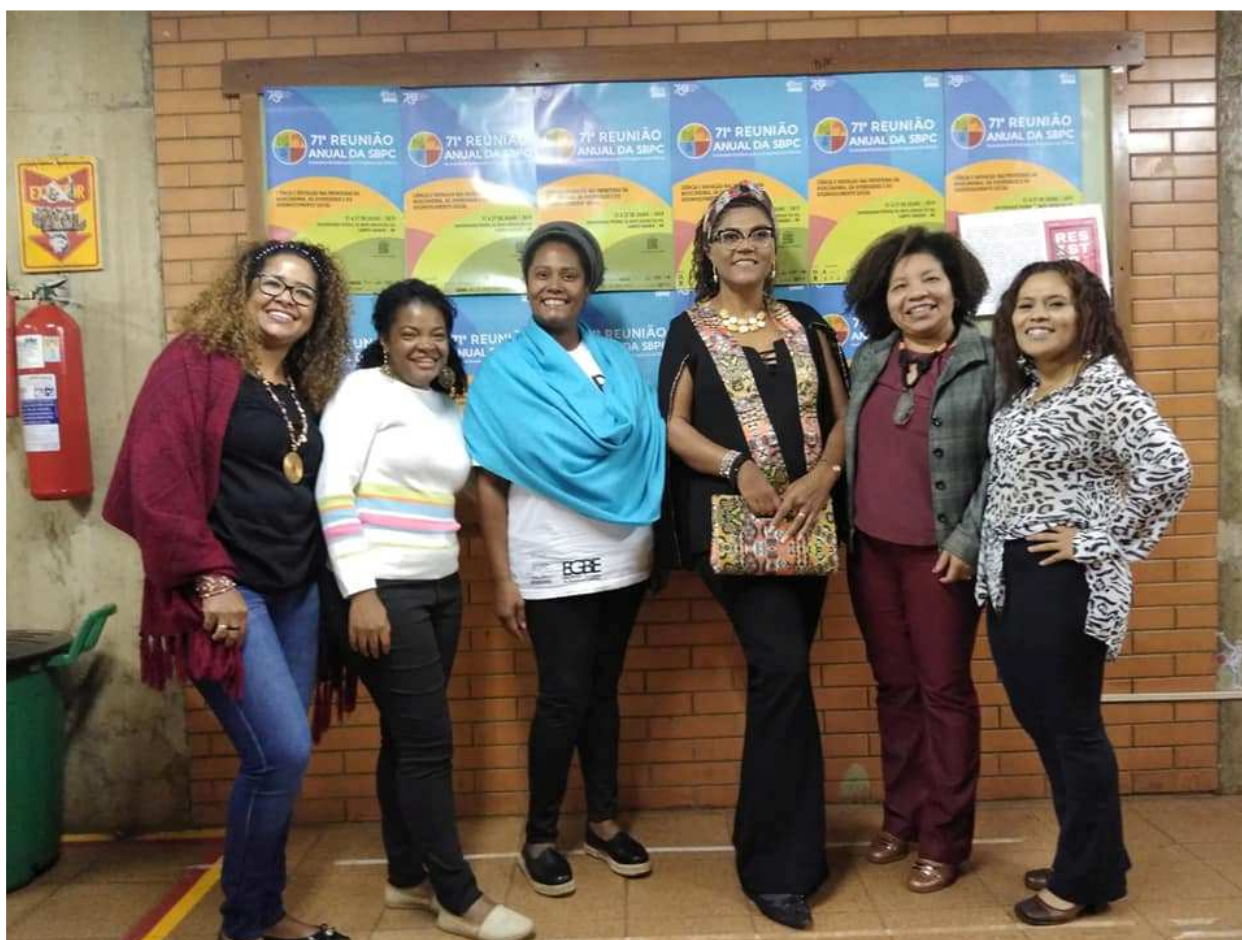
Pesquisadoras e integrantes do Grupo TEZ- Campo Grande -MS