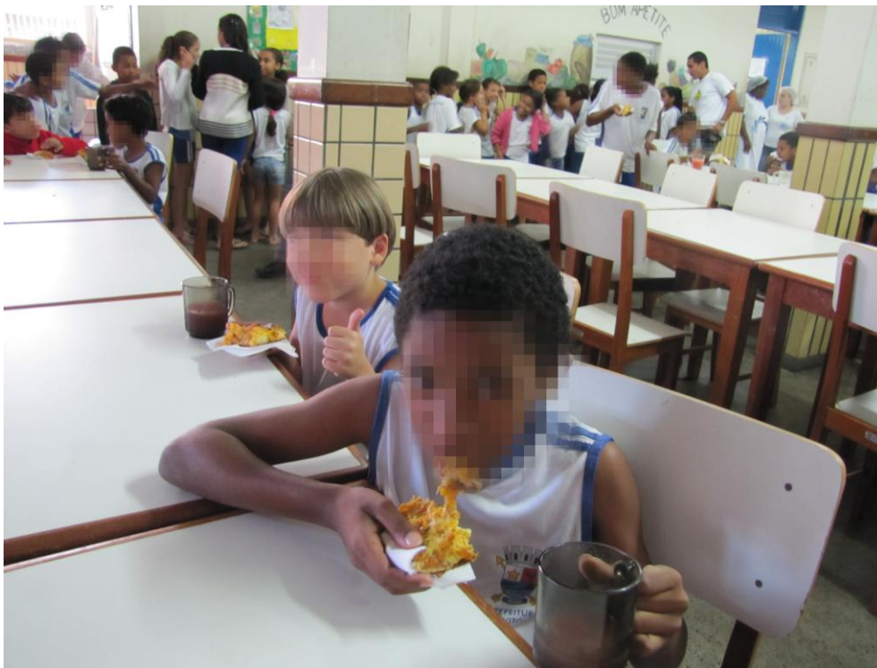
Fio 2 – Você tem sede de quê? Você tem fome de quê...? 5

Gostos, gestos, cheiros, cores, afetos, sabores, formas, texturas, consistências, atos, afectos, perceptos, movimentos, descanso, crianças, trabalhadores, calores, valores, conhecimentos, especiarias, utensílios, condimentos, comércio, múltiplas linguagens e sentidos habitam esse espaço.