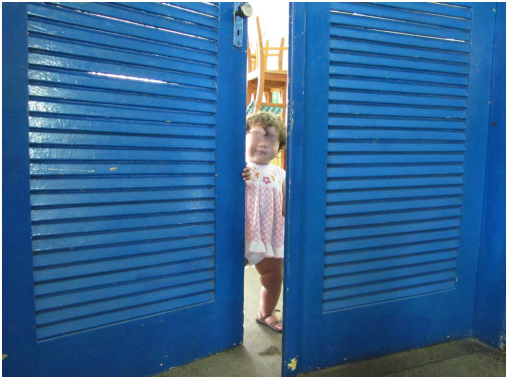
Fig 1 2 _ Posso entrar?